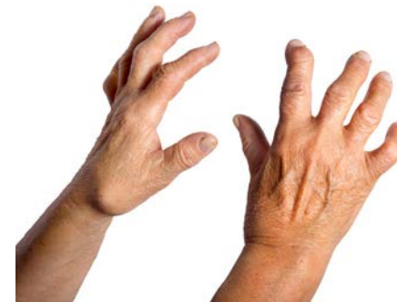
Polyarthritis an Finger- und Handgelenken

Als Polyarthritis bezeichnet die Medizin eine Entzündung von mindetens 5 Gelenken unseres Körpers. Häufigster Auslöser dafür ist die Rheumatoide Arthritis (auch chronische Polyarthritis), die häufigste entzündliche Erkrankung unserer Gelenke. Die Ursache für das Entstehen der Krankheit ist noch unbekannt, man vermutet aber