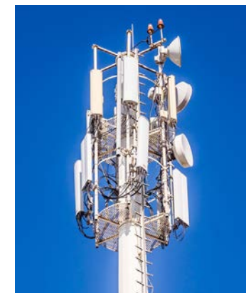
Mobilfunkmast einer Basisstation mit rechteckigen Mobilfunkantennen und runden Richtfunkantennen

Es grüsst Sie noch mal herzlich, Jürgen T.